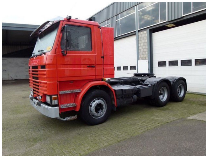
Scania R142-V8 142 - V8 - 6X4