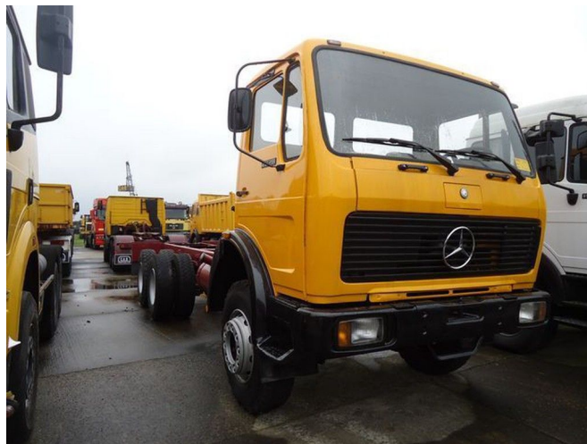
Mercedes-Benz 2628 - 6x4 - Chassis