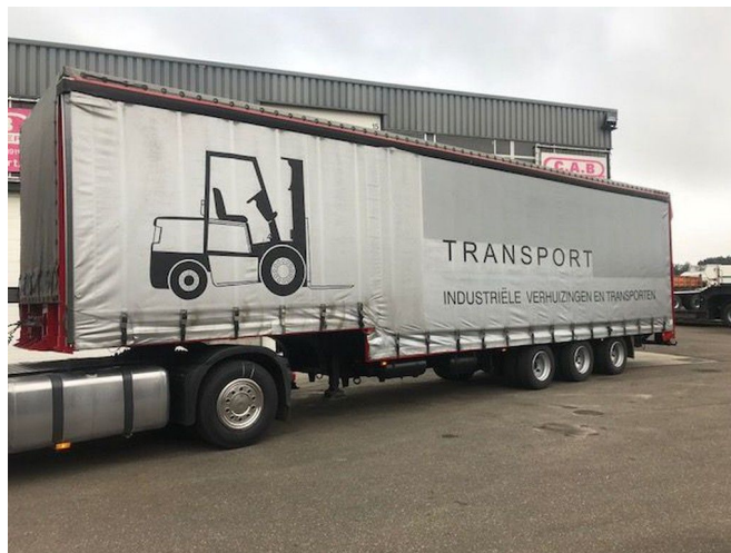
VAN HOOL SZ-304/27 - Volume >100M3