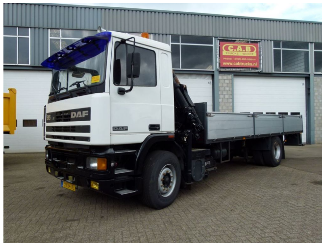
DAF 95.350 - 4x2 - Crane Pesci