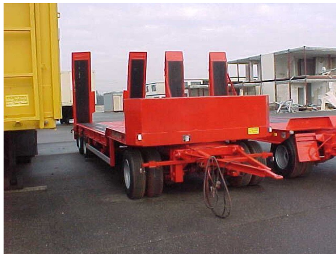
Bertoja Supercondor 30E / 3 axes