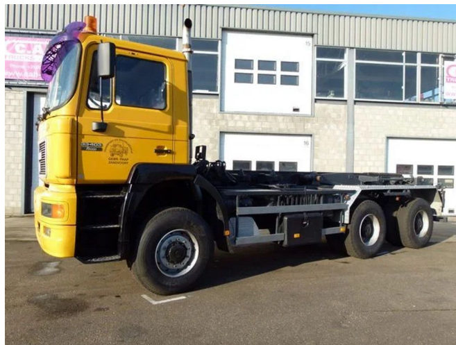
MAN 33.403 33.403 6x6 kettingsysteem