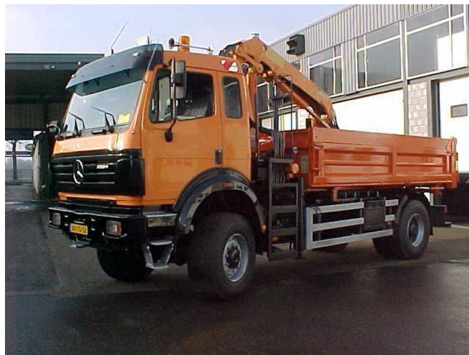
Mercedes-Benz 2024 AK 4x4 with crane HMF1153K2