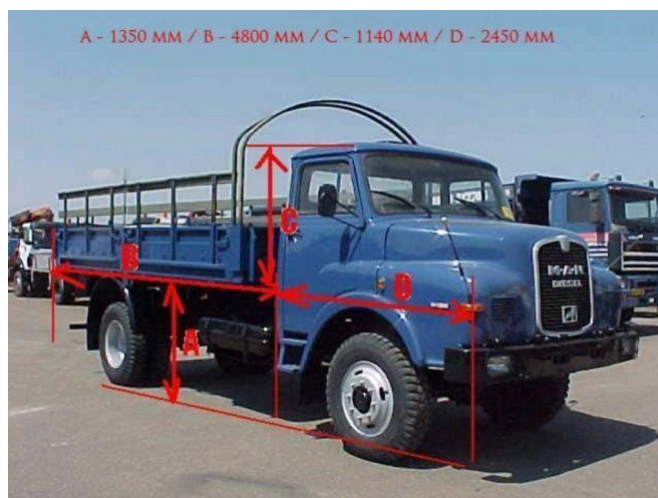
MAN 11.136 - 4x4