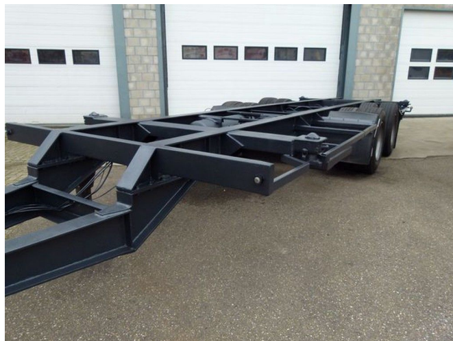
Netam-Fruehauf A2-218 / 20"