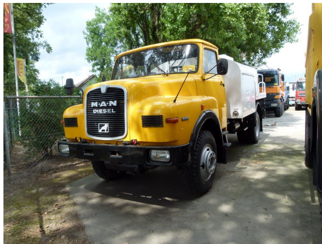
MAN 11.136 Fuel tanker - 4x4