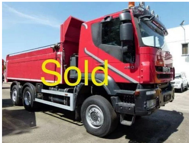
Iveco Trakker 450 SOLD VENDIDO