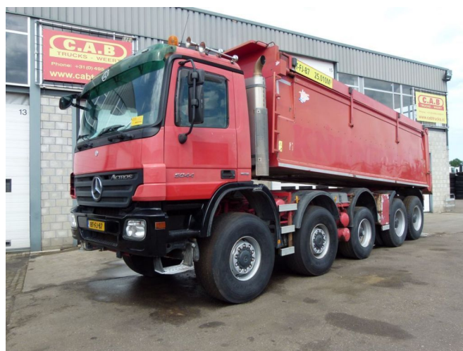
Mercedes-Benz Actros 5044 AK - 10x8