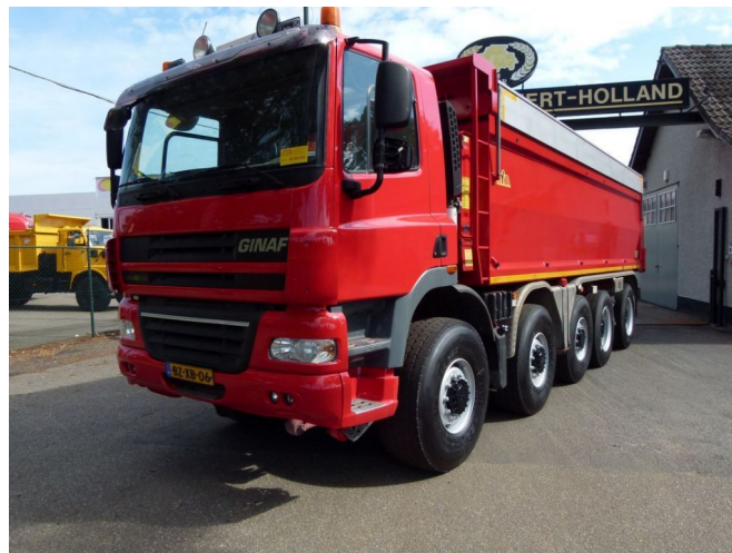
Ginaf X 5450 S - 10x8 - Asfaltkipper MANUAL GEAR