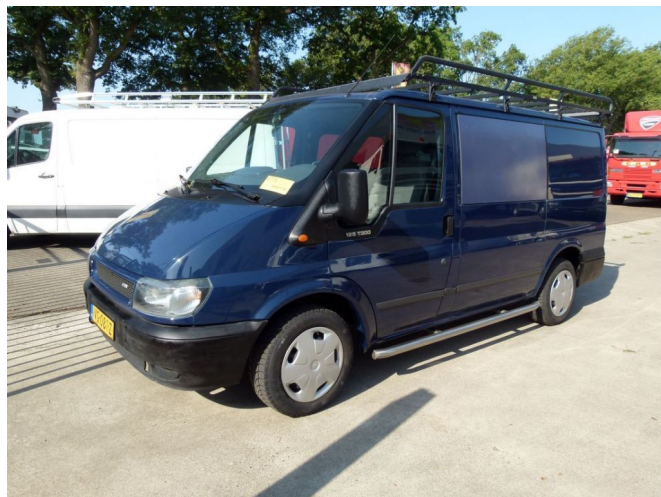
Ford TRANSIT 300S FD DC 125 LR 4.23