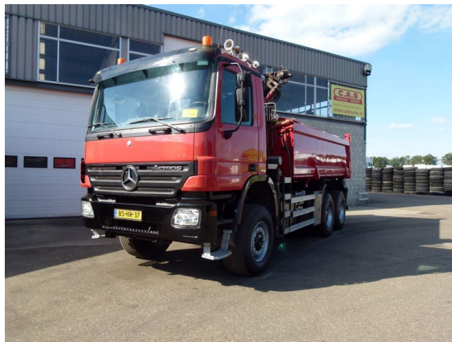
Mercedes-Benz AK 6x6 Steel Springs CRANE TIRRE 131