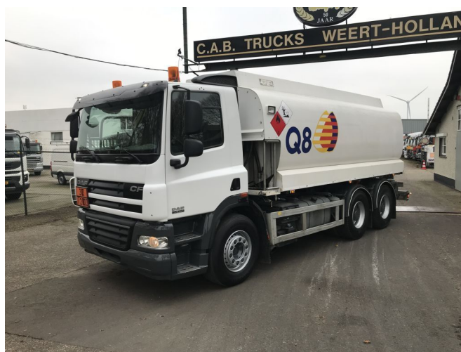
DAF CF85.410 6x4 Fuel tanker