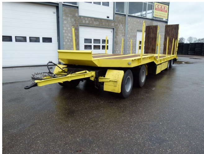
Goldhofer TU 4-30/80 (2+2)