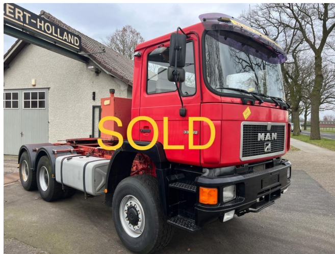
MAN 33.422 6x6 Hydraulique SOLD SOLD