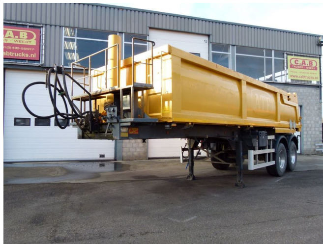
ATM OKHS 18/20