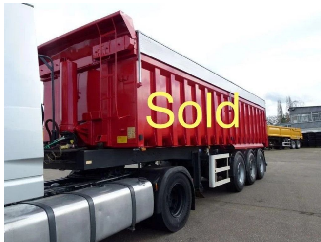
ATM OKA 17/27 SOLD SOLD