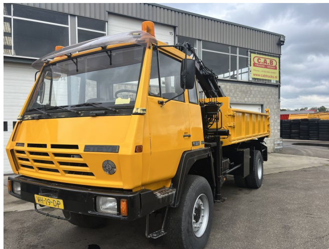
Steyr 19S31 4x4