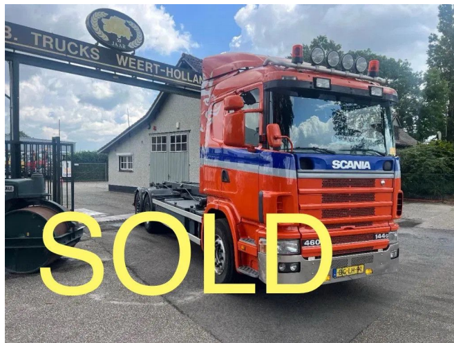
Scania V 8 144.460 MANUAL GEAR - SOLD - VENDU 6x2