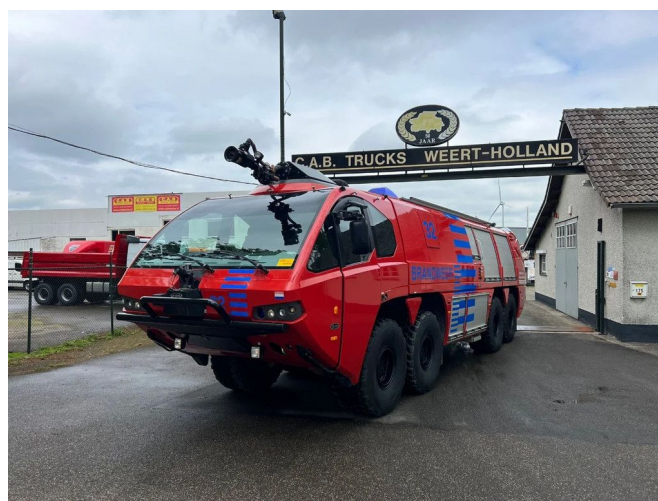
E-ONE CRASHTENDER 8X8 TITAN P6 HPR G-Series