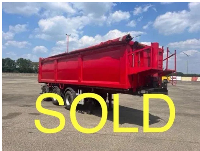
ATM 15-30 met oprolzeil - 2 Assen gestuurd - Liftas - SOLD - ...