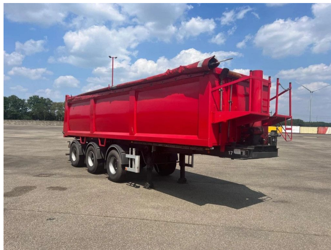
ATM 15-30 met oprolzeil - 2 Assen gestuurd - Liftas