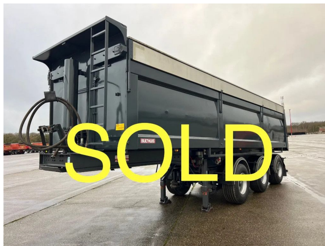
Bulhuis TATA 23 - voorzien van hydraulische milieukappen - 2...