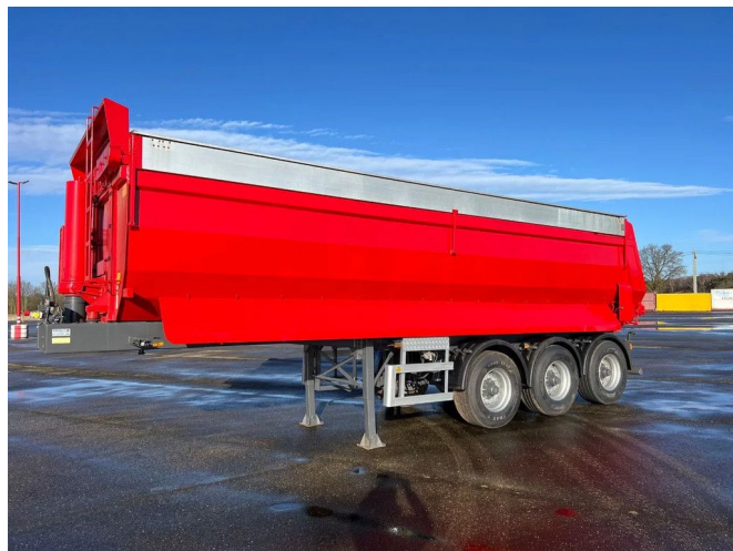
ATM OKA 17/27