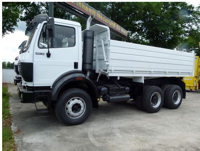
Mercedes-Benz SK 2631 K / 6x4 STEEL SPRINGS