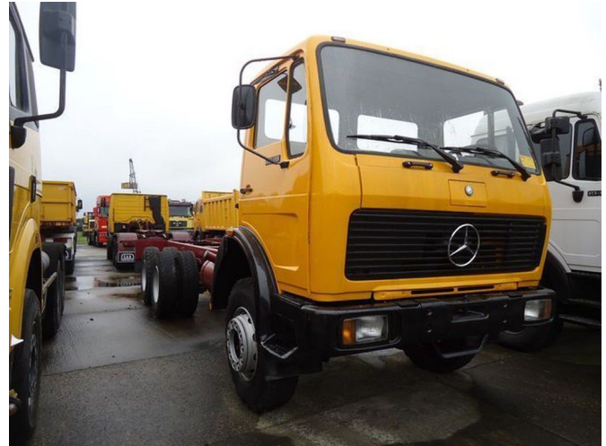
Mercedes-Benz 2628 - 6x4 - Chassis