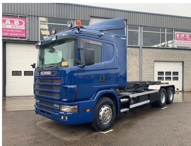
Scania 144G V8 460HP 6x2