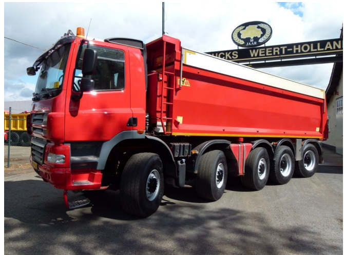
Ginaf X 5450 S - 10x8 - Asfaltkipper MANUAL GEAR