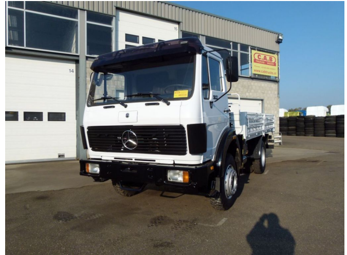
Mercedes-Benz 1017 A/4x4 with crane