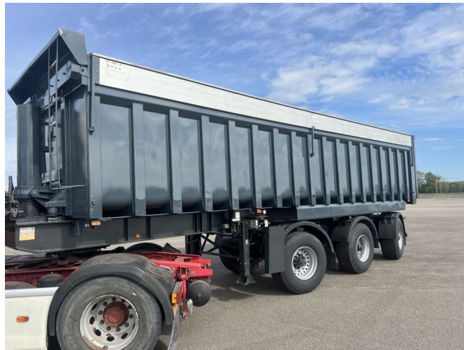
ATM OKF L SL 15/30