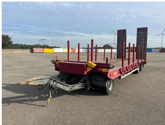
ATM 3 assen bladgeveerd APK t/m 26-2-2026