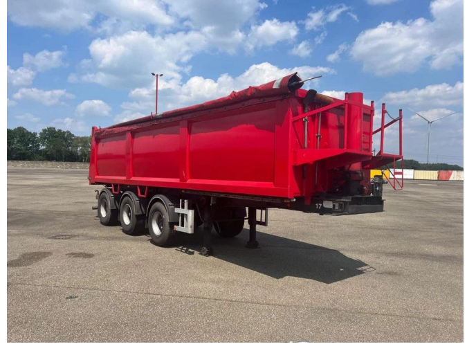
ATM 15-30 met oprolzeil - 2 Assen gestuurd - Liftas